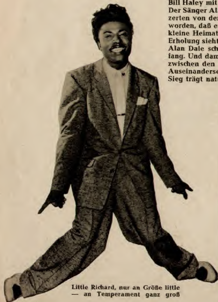
Little Richard, nur an Größe little — an Temperament ganz groß